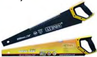
Cưa cầm tay