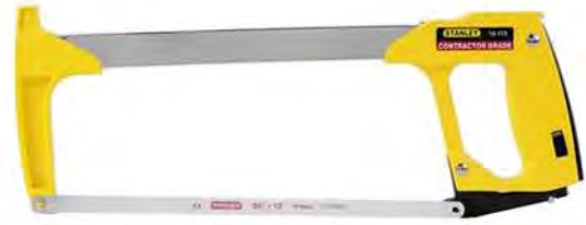
12" Cưa sắt model 15-113

Thiết kế sử dụng những công việc cưa nặng. Lưỡi cưa có thể điều chỉnh sức căng đến 32.000psi - lưỡi cắt nhanh và chính xác tuổi thọ cao. Lưỡi sơ cưa được tích hợp cắt trong khung. Tháo và thay lưỡi cưa nhanh bằng cơ chế điều khiển trong cán cầm, vẫn thiết đặt sức căng ban đầu. Bảng hướng dẫn cấp độ căng cán cưa. Chiều dài cưa 305mm, bề sâu của cưa 98mm. Mã đặt hàng: STL-015-150