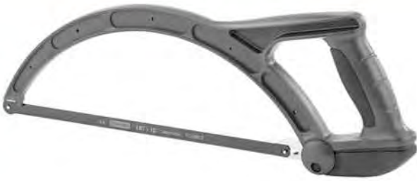
10" Cưa sắt Stanley model 15-892

Cấu trúc của cưa thiết kế với những rãnh chữ I chắc chắn, lưỡi cưa bằng thép sắt bén giúp cắt hay cưa dễ dàng, có thể thay thế lưỡi cưa nhanh chóng nhờ khoá vận linh hoạt. Tay cầm vừa vặn phù hợp với nhiều người khác nhau. Kiểu dáng khá hiện đại cộng với lưỡi cắt bén là ưu điểm nổi bật của cưa Stanley. Sản phẩm có xuất xứ từ Hoa Kỳ. Mã đặt hàng: STL-014-009